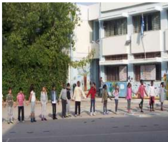
Εικόνα 8: Μουσικοκινητική Αγωγή

Ακολούθησε και τρίτη επικοινωνία στην οποία υπήρξε έντονο το κινητικό κομμάτι. Αυτή τη φορά τραγούδησαν παραδοσιακά τραγούδια και χόρεψαν παραδοσιακούς χορούς από τη χώρα τους καθώς επίσης και ελληνικούς παραδοσιακούς χορούς από την πλευρά του Διαπολιτισμικού σχολείου Αλσούπολης.