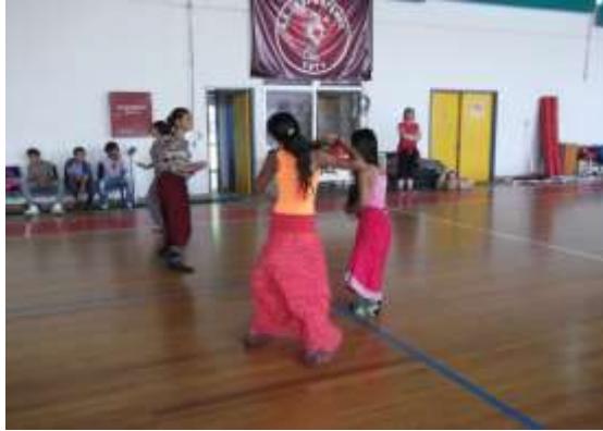
Εικόνα 3: Παραδοσιακός χορός 15 ο ΔΣ