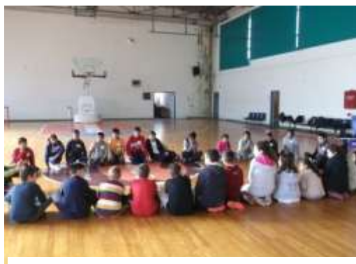
Εικόνα 1: Γνωριμία μαθητών

Στο πλαίσιο του προγράμματος πραγματοποιήθηκαν δύο διά ζώσης συναντήσεις του 7 ου & 15 ου Δημοτικού Σχολείου Ξάνθης. Η πρώτη μεταξύ τους συνάντηση, έγινε στο κλειστό γυμναστήριο της Ασπίδας (ΔΑΚ), χώρος κοντινός και στα δύο σχολεία. Εκεί δόθηκε η δυνατότητα στους μαθητές-τριες να γνωριστούν μεταξύ τους με μουσικοκινητικά παιχνίδια και να δημιουργήσουν από κοινού ομάδες συνεργασίας και ζευγάρια, και να ζωγραφίσουν.