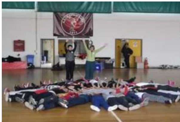
Εικόνα 5: Ψυχοκινητική Αγωγή

Η επαφή και των τριών σχολείων λόγω της δεδομένης απόστασης, έγινε μέσω Skype. Το Διαπολιτισμικό ΔΣ Αλσούπολης δεν είχε τη δυνατότητα της δια ζώσης επικοινωνίας με τα άλλα δύο σχολεία. Έτσι, με τη βοήθεια της τεχνολογίας, οι μαθητές-τριες και των τριών σχολείων κατάφεραν, να δουν και να συνομιλήσουν με μαθητές-τριες από άλλα σχολεία που βρισκόταν εκατοντάδες χιλιόμετρα μακριά τους. Πριν γίνει η επικοινωνία μεταξύ τους είχαν ήδη δει στο χάρτη σε ποίο σημείο της χώρας βρισκόταν τα σχολεία με τα οποία θα επικοινωνούσαν. Η απόσταση στο χάρτη τους έκανε να αναφωνήσουν, όμως τελικά κατάλαβαν ότι η τεχνολογία