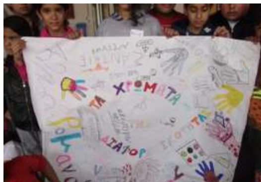
Εικόνα 2: Αποχρώσεις διαφορετικότητας

Σκόπιμα γινόταν συχνή εναλλαγή ζευγαριών και ομάδων για να επιτευχθεί ο στόχος της γνωριμίας όλων. Στη συνέχεια, πήραν μέρος στο πρόγραμμα «Kids Athletics». Τους δόθηκε η δυνατότητα να δημιουργήσουν ομάδες και να συνεργασθούν μεταξύ τους με εναλλαγή ρόλων και ομάδων, σύμφωνα με το άκουσμα μουσικής. Η συνάντηση ολοκληρώθηκε με παραδοσιακά τραγούδια και χορό και από τα δύο σχολεία.