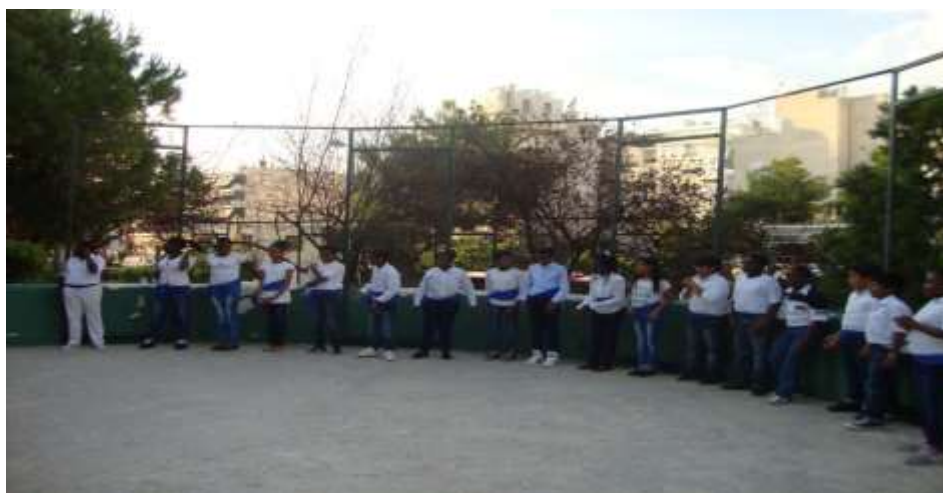
Εικόνα 9: Παραδοσιακοί Ελληνικοί Χοροί από το Διαπολιτισμικό ΔΣ

Ακολούθησε και τρίτη επικοινωνία στην οποία υπήρξε έντονο το κινητικό κομμάτι. Αυτή τη φορά τραγούδησαν παραδοσιακά τραγούδια και χόρεψαν παραδοσιακούς χορούς από τη χώρα τους καθώς επίσης και ελληνικούς παραδοσιακούς χορούς από την πλευρά του Διαπολιτισμικού σχολείου Αλσούπολης.