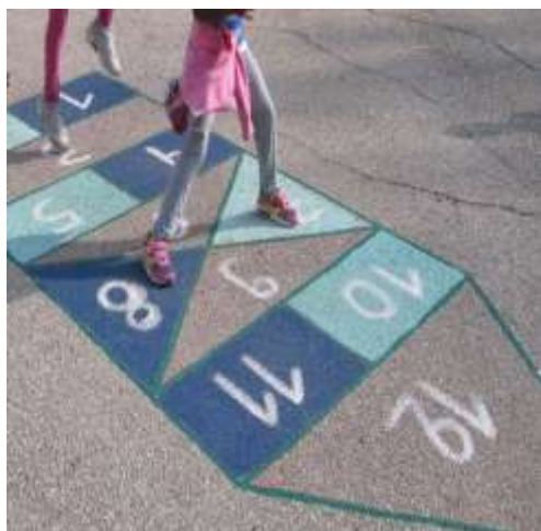
Εικόνα 7: Παραδοσιακά παιχνίδια

διατροφικές τους συνήθειες και να ανταλλάξουν παραδοσιακές συνταγές που είχαν καταγράψει από το οικογενειακό τους περιβάλλον και τέλος να παίξουν παραδοσιακά παιχνίδια.