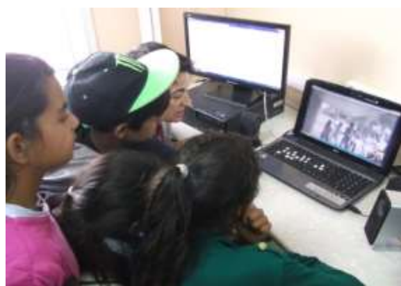
Εικόνα 6: Επικοινωνία μαθητών με Skype

χαμογεστά τους πρόσωπά και στη λαχτάρα τους να μάθουν όλο και περισσότερα για αυτά. Μίλησαν για τους τόπους και τις χώρες καταγωγής τους, για το τι τους αρέσει και τους ευχαριστεί και έκλεισαν με λαχτάρα την επόμενη συνάντηση. Στην επόμενη εξ' αποστάσεως συνάντηση είχαν την ευκαιρία να συζητήσουν για πολιτισμικά θέματα, για τα ήθη και τα έθιμα της χώρας και του τόπου καταγωγής τους. Να μιλήσουν για τις