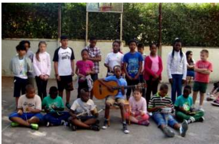
Εικόνα 10: Το τραγούδι του ΔΣ Διαπολιτισμικής εκπ/σης αποδεικνύοντας ότι όλα τα παιδιά είναι ίσα, ανεξάρτητα από το χρώμα, το φύλο και τη θρησκεία.

Η συμμετοχή σε κινητικές δραστηριότητες, μπορεί να συμβάλει στην αποδοχή της διαφορετικότητας και στο σεβασμό της πολιτισμικής κληρονομιάς και να αναπτυχθούν θετικές στάσεις ζωής. Η Φυσική Αγωγή λόγω της φύσης του μαθήματος και των στόχων που αντιπροσωπεύει, μέσα από ποικίλες κινητικές και αθλητικές δραστηριότητες, να βοηθήσει στη σωματική ανάπτυξη των μαθητών και να συμβάλει στην ψυχική και πνευματική τους καλλιέργεια, καθώς και την αρμονική τους ένταξη στην κοινωνία (ΦΕΚ 304/13-3-2003, τ. Β'), μπορεί να γίνει η διόδος μέσα από την οποία μπορούν να εξαλειφθούν στερεότυπες αντιλήψεις και φαινόμενα ρατσισμού και ξενοφοβίας, καθώς επίσης την κατάργηση των συνόρων και την εξομάλυνση των εθνικών και φυλετικών διαφορών (Αθανασόπουλος, 2001), αποδεικνύοντας ότι όλα τα παιδιά είναι ίσα, ανεξάρτητα από το χρώμα, το φύλο και τη θρησκεία.