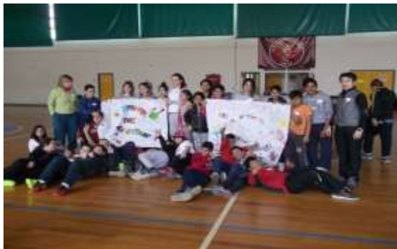
Εικόνα 12: Το 7 ο και 15 ο ΔΣ Ξάνθης