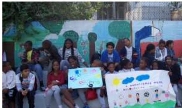
Εικόνα 11: Το ΔΣ Διαπολιτισμικής Εκπ/σης Αλσοούπολης Αττικής