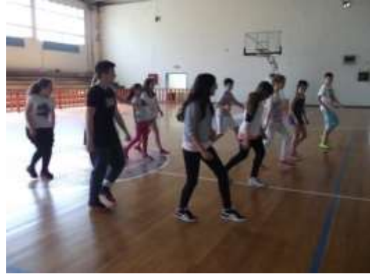
Εικόνα 4: Παραδοσιακός χορός 7 ο ΔΣ

Η επαφή και των τριών σχολείων λόγω της δεδομένης απόστασης, έγινε μέσω Skype. Το Διαπολιτισμικό ΔΣ Αλσούπολης δεν είχε τη δυνατότητα της δια ζώσης επικοινωνίας με τα άλλα δύο σχολεία. Έτσι, με τη βοήθεια της τεχνολογίας, οι μαθητές-τριες και των τριών σχολείων κατάφεραν, να δουν και να συνομιλήσουν με μαθητές-τριες από άλλα σχολεία που βρισκόταν εκατοντάδες χιλιόμετρα μακριά τους. Πριν γίνει η επικοινωνία μεταξύ τους είχαν ήδη δει στο χάρτη σε ποίο σημείο της χώρας βρισκόταν τα σχολεία με τα οποία θα επικοινωνούσαν. Η απόσταση στο χάρτη τους έκανε να αναφωνήσουν, όμως τελικά κατάλαβαν ότι η τεχνολογία